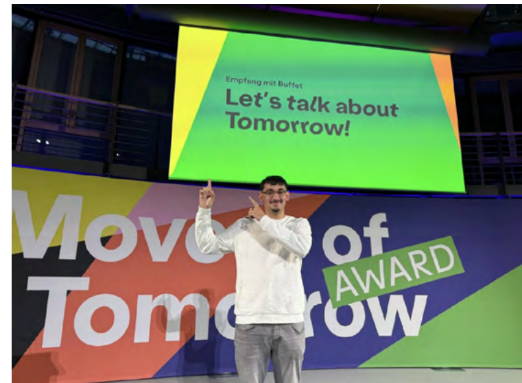
Leonardo als Aktivist auf einem »Let's talk about Tomorrow« Event in Berlin.

helfen, emotionale und menschliche Aspekte dieser Zeit besser zu verstehen.