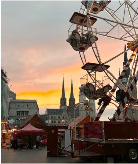
Halle an der Saale