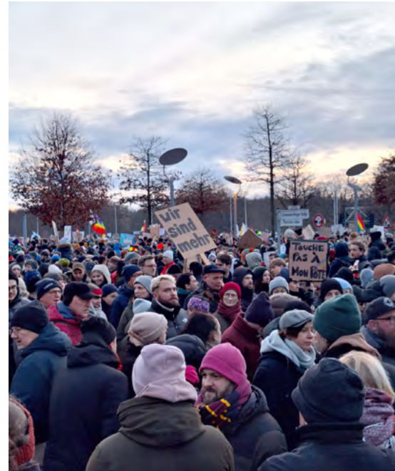
Demo gegen rechts, 21. Januar 2024 am Platz der Republik in Berlin