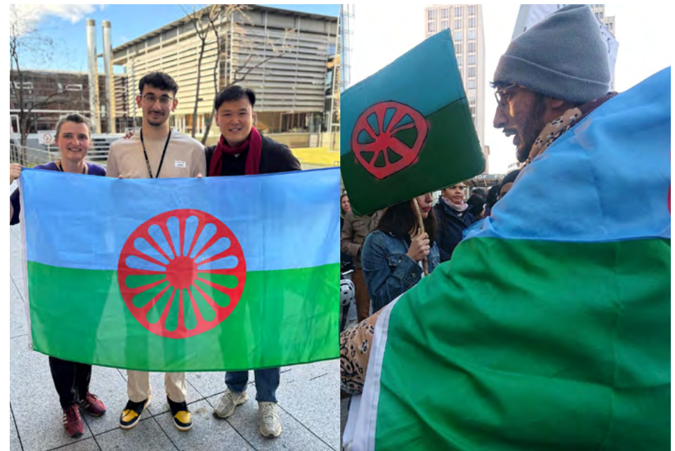
Leonardo beim Protest »Rettet das Mahnmal!« im Herbst 2024