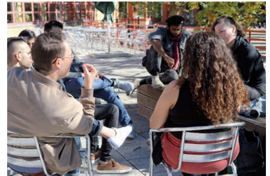
Die Fotos in diesem Schwerpunkt stammen von Fotograf*innen aus der Community und anderen jugendlichen Teilnehmer*innen der Projekte von Amaro Drom. Die Bilder sind selbstbestimmte Repräsentationen junger Rom*nja und Sinti*zze. Wir danken Amaro Drom und den Fotograf*innen für die Genehmigung zum Abdruck

mund, Duisburg oder Mannheim, die immer wieder mit Negativschlagzeilen in den Medien sind, da sie einen hohen Zuzug von Bulgar*innen und Rumän*innen in verarmte Stadtviertel aufweisen. Die Armut dort war allerdings schon vorher da und die meisten dieser Städte sind überdurchschnittlich verschuldet. Die sozialen Probleme können diese Städte letztlich ohne finanzielle Unterstützung der Länder oder des Bundes nicht lösen. Was die Finanzkrise angeht, müssen wir uns als Europäer*innen die Frage stellen, wie es sein kann, dass europäische Regierungen nahezu vorbei an der parlamentarischen Souveränität Sonderhaushalte zur Rettung von Banken beschließen, aber gleichzeitig Städte wie Duisburg keine finanziellen Mittel für ihre sozialpolitischen Herausforderungen zur Verfügung gestellt bekommen.